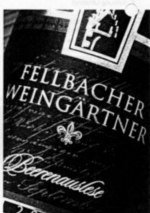
Beerenauslese aus Fellbach: pikante Würze.

Ananas und andere tropische Früchte in der Nase; schlanker, zartgliedriger Wein mit pikanter Würze und gutem Biss. 2005 bis 2012.